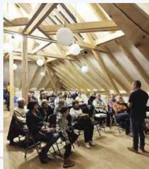
Podkrovní přednáškový sál knihovny.