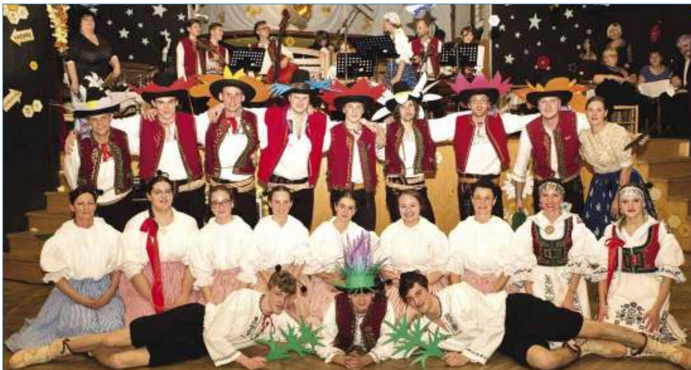
Minule to na Valašském bále hučelo jak v úle. Tak se těšme, co si pro nás letos tyhle včeličky připraví.