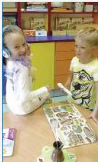
Sluchátka Albi tužka.