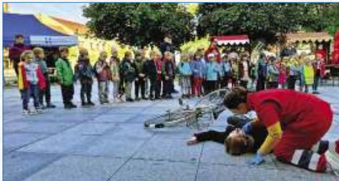
Den bez aut.