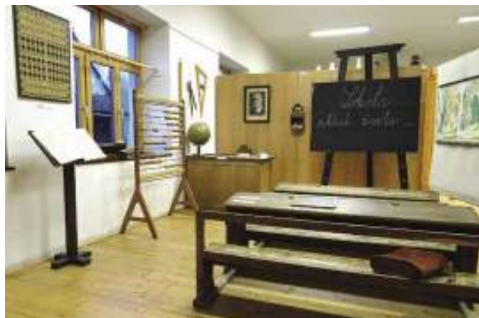
Pohled do výstavy Škola základ života s historickými lavicemi a katedrou asi z obecné školy ve Vranči.