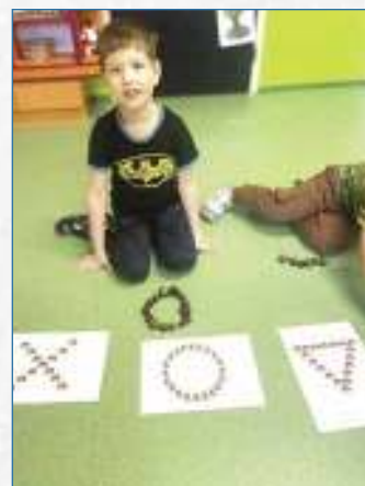
Tvoření z kaštanů.