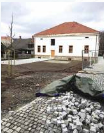
Úprava venkovního prostoru za knihovnou.