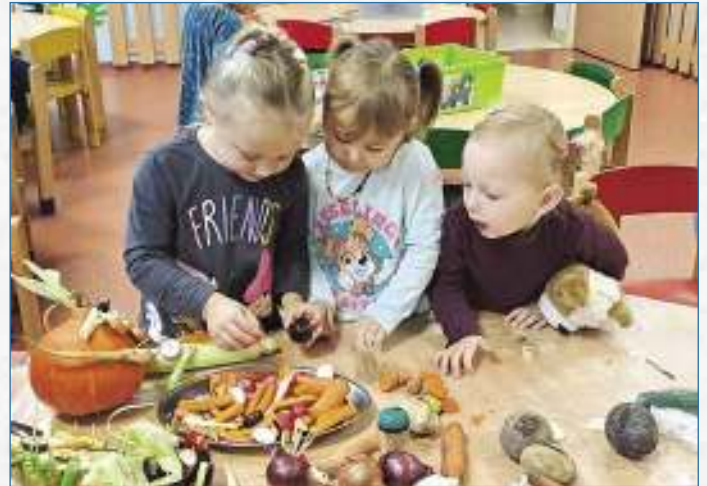
Výroba zeleninových strašidýlek.

V říjnu děti z Berušek pouštěly draky, Sluníčka navštívila místní kostelík, kde zhlédla oltářové předkování za úrodu. V tomto duchu jsme následně týdny pokračovali i ve školce, kdy jsme využívali ovoce i zeleninu jak na výchovně-vzdělávací aktivity, tak na tvoření, a to až už bramborová tiskátka, ovocné a zeleninové saláty, pekli jsme štrůdky či zdobili dýně a vyráběli zeleninová strašidýlka. Uskutečnila se také první společná akce školky s rodiči a dětmi na zahradě MŠ s názvem Po stopách podzimních skřítků, kde byla připravena různá stanoviště, na kterých rodiče s dětmi plnili logické, pohybové či tvořivé úkoly. Od tohoto měsíce se nám také po dlouhém hledání podařilo zajistit novou paní logopedku, která se bude dětem věnovat každou středu od oběda. Mimo tuto péči probíhá každý den na všech třídách logopedická prevence, kterou provádí paní učitelky, které absolvovaly kurzy pro logope-