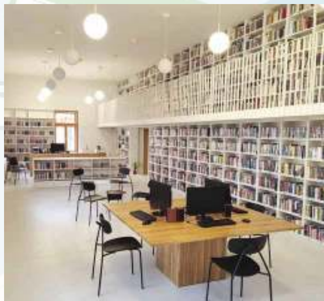
Hlavní velká knihovna.