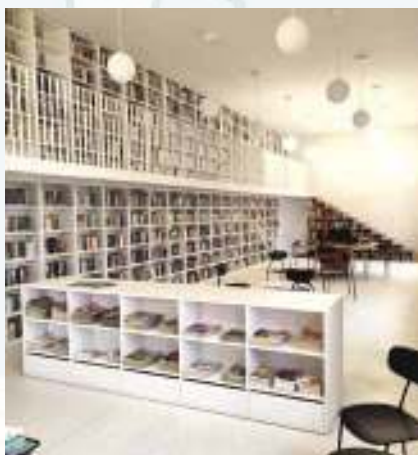
Hlavní velká knihovna.