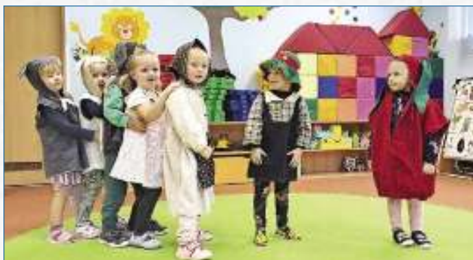
Dramatizace pohádky O veliké řepě.

dické asistenty-preventisty či získaly vzdělání během studia na vysokých školách. Navštívila nás také první pohádka v tomto školním roce, a to O začarovaném lese. V druhé polovině měsíce se děti ze Sluníček a Berušek zúčastnily projektového dne Den stromů ve Vsetíně, kde v městském parku plnily rozmanité úkoly k tématu, a to až už didaktické, či pohybové, vyzkoušely si např. i výrobu jablečného moštu. Uskutečnil se také projektový den Malé technické univerzity s názvem Malí architekti, kdy pod vedením instruktorky stavěly domy podle stínového zadání, procvičovaly prostorovou představivost či plnily úkoly na zahradě MŠ, kdy skládaly z dřevěných špachtlí domečky a lepily je na velkoformátové papíry dle vlastní fantazie. Ve třídě Berušek proběhly projektové dny s halloweenskou tematikou, které byly promyšleny do posledního detailu, a to co se týče výzdoby, pochutin, pokusů, kostýmů či dalších aktivit, i přesto jsme však nezapomněli na naši tradici Dušiček, kdy všechny děti navštívily místní hřbitov.