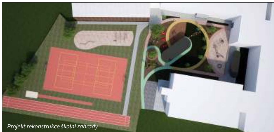
Projekt rekonstrukce školní zahrady

střechy budovy školy B – 1. stupně. Dojde k výměně střešního pláště, který byl opakovaně poškozován větrem. Značné problémy způsobují také zastaralé okapy.