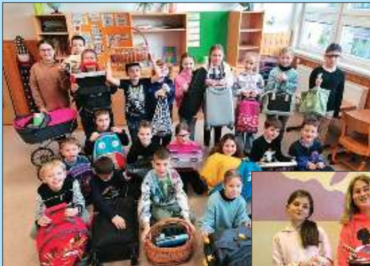
No Bag Day – cílem akce bylo přinést školní potřeby v něčem jiném než v tradičním školním batohu.

Děti se naučily, jak s vodou hospodařit a neplýtvat s ní, jak se chovat k přírodě, aby v ní voda zůstávala.