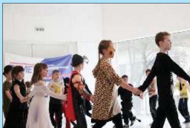
Maškarňní karneval – sportovně laděné odpoledne s diskotékou pro školní družinu.