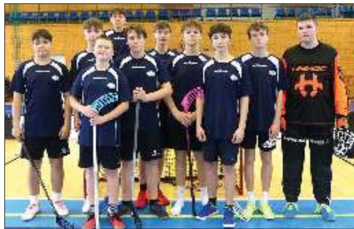
Florbalové družstvo žáků na turnaji TMStav Cup získalo 2. místo.

lí uzavírání klasifikace a žáci se těší zejména na školní výlety jak na vícedenní pobyt do Prahy, i do Pevnosti poznání v Olomouci, do akční pevnosti Boyard v Rožnově, na nocování v kempu, do Jumping parku v Olomouci, Na Landek a do podzemních štol v Ostravě nebo Liščího mlýna ve Frenštátu p. R.