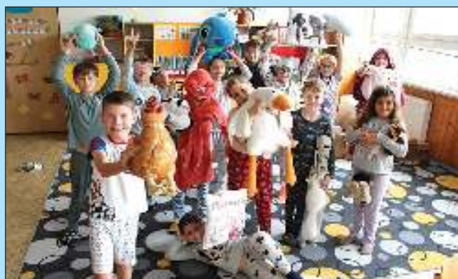
Pyžamový den – studenti i někteří z učitelů přišli do školy oblečení v pyžamech.

Ukázku z knížky Kanálníčci zajímavě a vtipně ztvárnil herec a moderátor Miroslav Reil, který svým zvucným hlasem všechny vtáhl do děje. Beseda se dětem velmi líbila a věříme, že pro ně bude další motivací pro čtení a návštěvu knihovny.