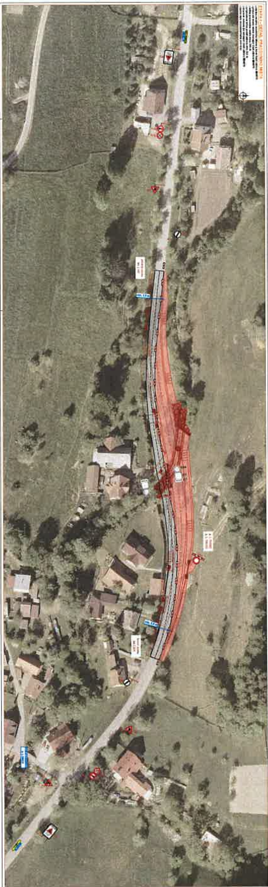
Figura 2.11 - Mapa de Localização Localização do Projeto em relação ao Município de São Paulo, Estado de São Paulo. Escala: 1:50.000 Data: 10/2023