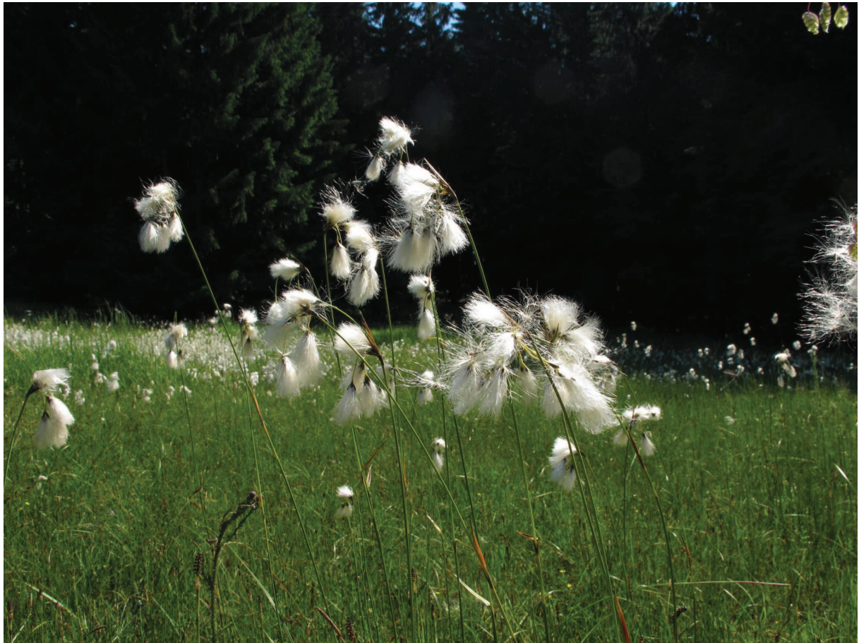
Vápnité slatiniště se suchopýrem širolistým