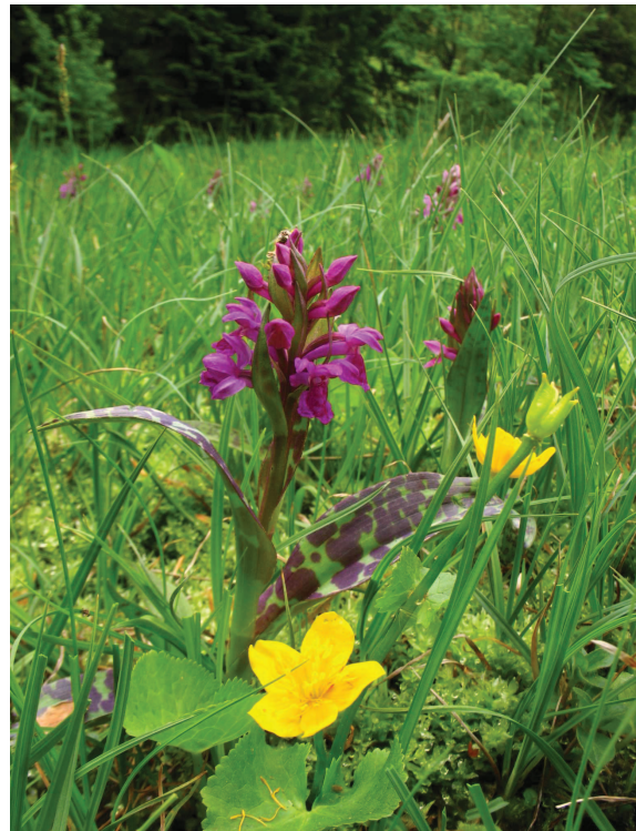
Blatouch bahenní a prstnatec májový