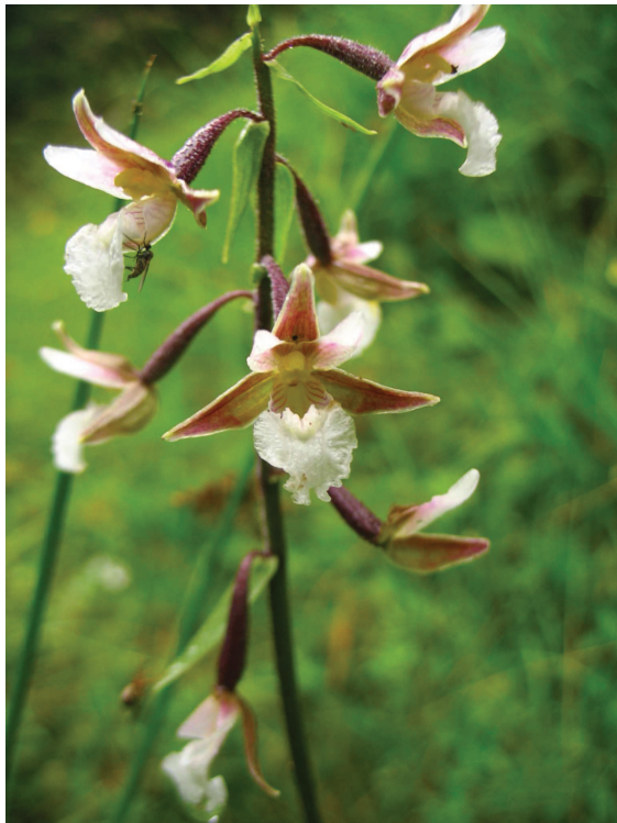
Mokřadní orchidej kruštík bahenní